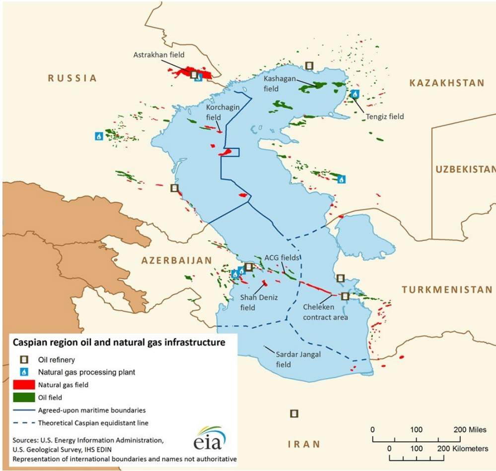
Şekil 2. Hazar Gölü Bölgesindeki Petrol ve Doğal Gaza Genel Bakış. (Hazar Bölgesi Petrol ve Doğalgaz Altyapısı 26 Ağustos 2013, Independent Statistics and Analysis U.S Energy Information Administration, https://www.eia.gov/international/analysis/regions-ofinterest/Caspian_Sea ).

Sıvılaştırılmış doğal gaz ve yenilenebilir enerji kaynakları ile tedarikini çeşitlendirme ve genişletmeye çalışan Avrupa ülkelerinin dikkatini, Hazar denizi kıyısında önemli enerji kaynaklarına sahip üç ülke çekmektedir. Bunlar Azerbaycan, Kazakistan ve Türkmenistandır.