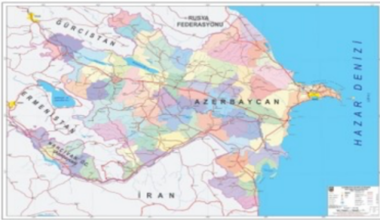
Şekil 1. Azerbaycan Topraklarının Güncel Siyasi Haritası. (1:750.000 Ölçekli Raster Azerbaycan Siyasi Haritası, Türkiye Cumhuriyeti Millî Savunma Bakanlığı Harita Genel Müdürlüğü, https://www.harita.gov.tr/urun/1750000-olcekli-raster-azerbaycan-siyasiharitasi/615 .)

Azerbaycan, uluslararası arenada Türkiyenin de desteğiyle 2020 yılında Karabağ bölgesini Ermenistanın işgalinden kurtarmıştır. (Bkz. Şekil 1)