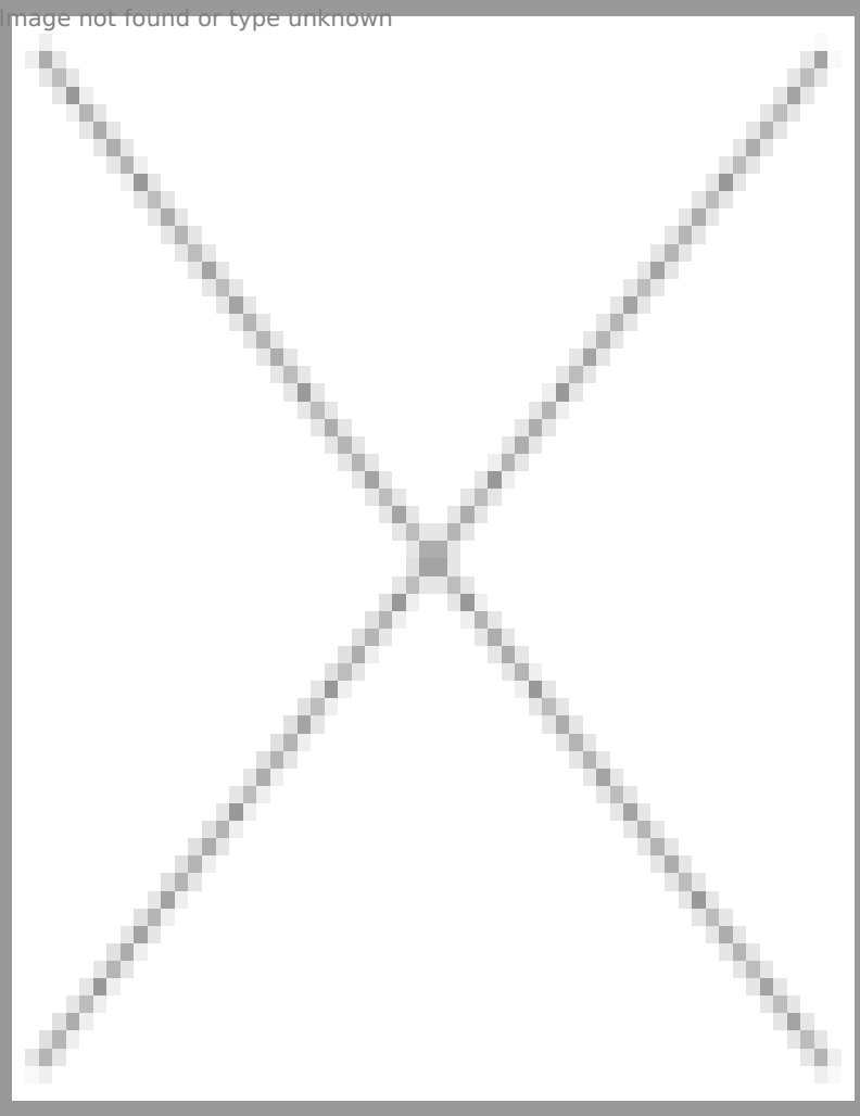
Ermenistan-Maralikteki Soğomon Tehliryan heykelinin Türk basınında paylaşılan fotoğrafı